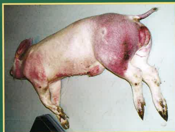
Krvavi proljev i crvenilo na koži vrata, grudi i nogu

ASK se manifestira različitim kliničkim znakovima. Zaražene, bolesne svinje uglavnom ugibaju. Obično se javlja gubitak apetita, ležanje i nevoljkost, a svinje brzo i iznenada uginu. Rijetko se pojavljuju drugi klinički znakovi: potištenost, gubitak tjelesne težine, krvarenja na koži (vrhovi uški, rep, noge, grudna i trbušna regija), otežano kretanje i pobačaji krmača. Klinički znakovi se teže uočavaju u divljih svinja.