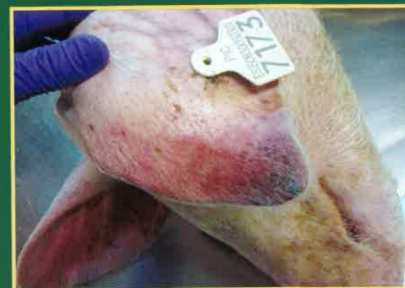
Cijanoza – plavo ljubičasta boja na vrhovima uški