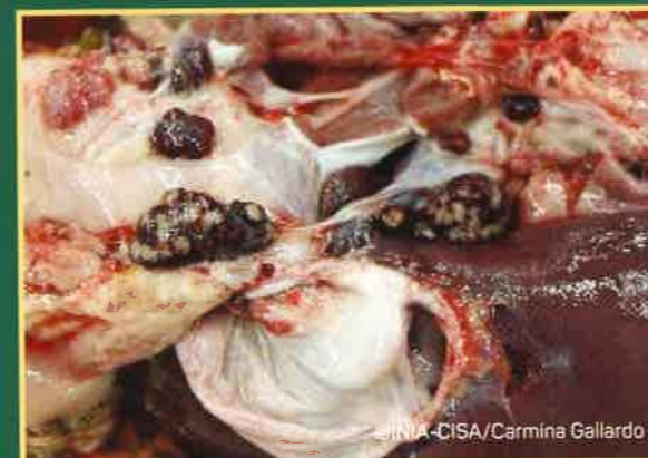
Krvavi limfni čvorovi