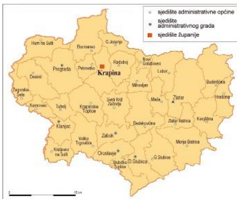
Slika 1. Smještaj općine Veliko Trgovišće u Krapinsko - zagorskoj županiji

Općina Veliko Trgovišće s istoimenim sjedištem, smještena je u jugozapadnom rubu Krapinsko - zagorske županije na granici prema Zagrebačkoj županiji u neposrednoj blizini Grada Zagreba od kojeg je udaljena svega tridesetak kilometara. Općina se prostire na površini od 46,65 km 2 , što iznosi 3,81 % ukupne površine Županije (Slika 4).